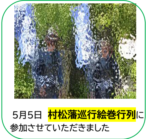
5月5日 村松藩巡行絵巻行列に参加させていただきました