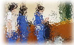
県立村松高等学校の生徒と 対面式5月9日