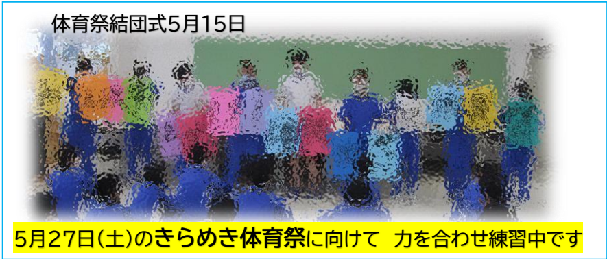
体育祭結団式5月15日