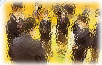
1年生と2,3年生の対面式